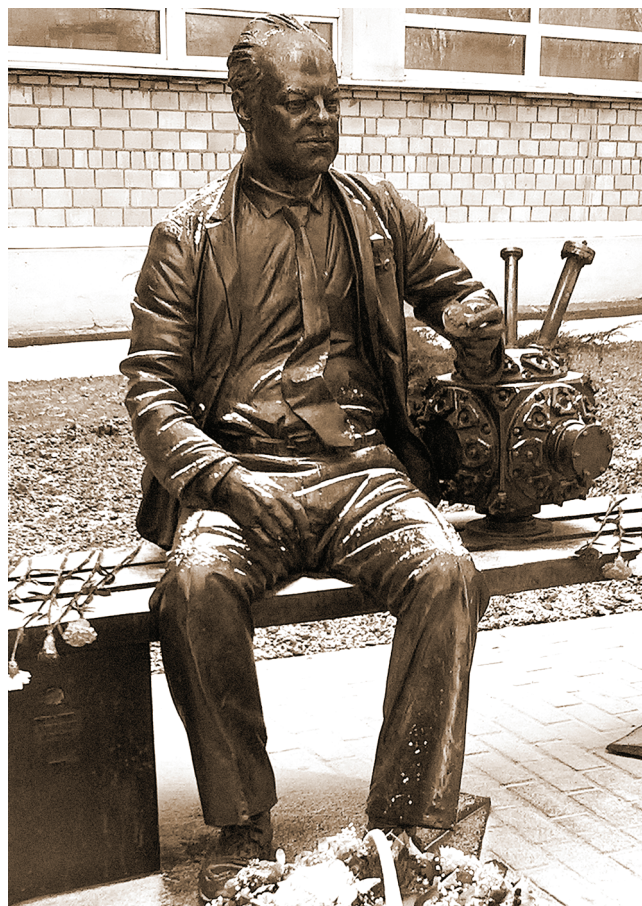
Теперь он здесь навсегда. Фото сделано 24 ноября 2017 г. в день открытия в МИФИ памятника Н.Г.Басову.

Конечно, невозможно перечислить все, что он оставил нам, его ученикам и последователям, в качестве наследства своей очень активной и плодотворной творческой